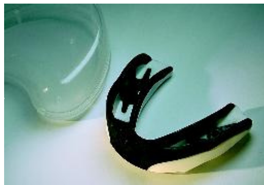
Gebitsbeschermer, te koop in sportwinkels

Gebitsletsel kunt u soms voorkomen. Tijdens het sporten kunt u bijvoorbeeld een gebitsbeschermer dragen. Die biedt geen garantie, maar kan de eventuele schade bij een ongeluk beperken. Er bestaan verschillende soorten beschermers. Kant-en-klare zijn te koop in sportwinkels. Deze passen vaak niet goed en beschermen daarom onvoldoende. Het beste werkt de gebitsbeschermer die precies op maat is gemaakt door uw tandarts.