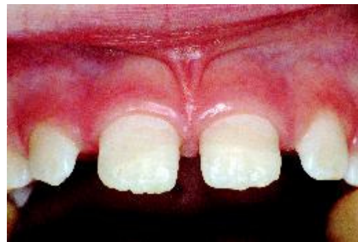
... en hersteld