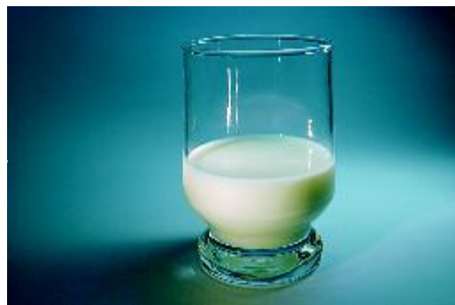
Bewaar de tand in melk