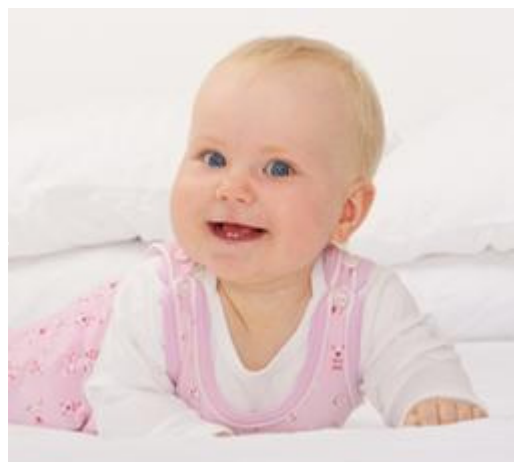
Neem je kind als het eerste tandje doorbreekt mee naar de tandarts