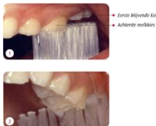
Als je de tanden in de lengterichting poetst, sla je de nieuwe blijvende kies die doorbreekt over (foto 1). Juist de nieuwe kiezen zijn extra kwetsbaar. Zet de tandenborstel daar dwars op de tandenrij (foto 2)

Een kind wisselt zijn melkgebit tussen zijn 6 e en 13 e jaar. Op de plaats van de melktanden en -kiezen komen blijvende exemplaren. Rond het 6 e levensjaar breekt achter de laatste melkkies een nieuwe, blijvende kies door. Dit gebeurt meestal al voordat de voortanden wisselen. De nieuwe kiezen liggen een beetje verscholen. Veel kinderen en ouders merken niet dat de eerste blijvende kiezen doorbreken. De verzorging van deze kiezen is erg belangrijk. Het glazuur van de pas doorgebroken kies is nog erg poreus en kwetsbaar. Poets de puntjes van de nieuwe kiezen meteen mee zodra ze zijn doorgekomen. Rond het 12 e jaar breken opnieuw blijvende kiezen door. Ook die zijn net na het doorbreken extra gevoelig voor het krijgen van gaatjes. De verstandskiezen zijn de laatste kiezen die doorbreken. Een volledig blijvend gebit bestaat uit 12 tanden en 16 kiezen. De verstandskiezen zijn hierbij niet meegerekend. Die breken op latere leeftijd door. Sommige mensen krijgen geen verstandskiezen.