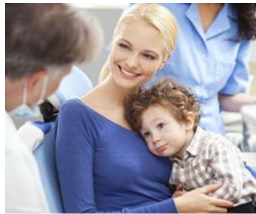
De tandarts of mondhygiënist geeft je adviezen om het gebit van je kind gezond te houden