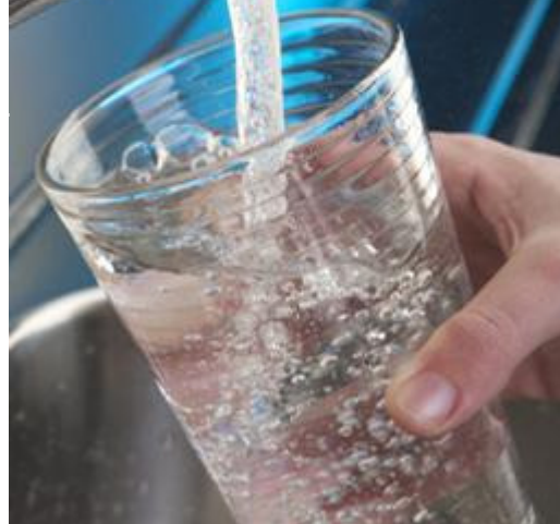
Kies voor kraanwater in plaats van zoete dranken

nodig. Beperk daarom het aantal eet- en drinkmomenten van je kind tot maximaal 7 per dag. Dat is 3x een maaltijd en maximaal 4x per dag een tussendoortje. Geef je kind liever hartige dan zoete dingen. Probeer je zoon of dochter niet aan zoetheid te laten wennen en voeg aan voedsel en dranken geen suiker toe. Kies voor kraanwater in plaats van zoete dranken. Lightfrisdranken veroorzaken weliswaar geen gaatjes, maar bedenk dat deze, evenals de suikerhoudende varianten, nog wel zuur kunnen zijn. Ook zure producten kunnen bij veelvuldig gebruik schade veroorzaken aan het gebit. Die schade noemen we tanderosie.