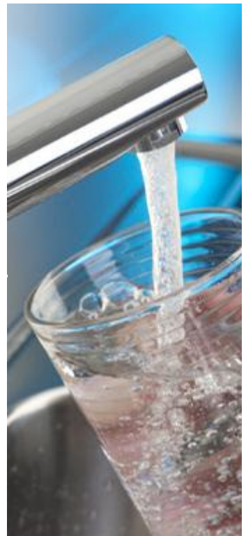
Kies voor kraanwater in plaats van

Kies voor kraanwater in plaats van zoete dranken. Lightfrisdranken veroorzaken weliswaar geen gaatjes, maar bedenk dat deze, evenals de suikerhoudende varianten, nog wel zuur kunnen zijn. Ook zure producten kunnen schade veroorzaken aan het gebit.