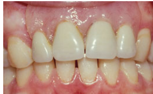
Plaatprothese van voren

De plaatprothese is gemaakt van een roze, tandvleeskleurige kunsthars. Daarin zijn de kunsttanden en kiezen verankerd. De gehele plaatprothese rust op het slijmvlies van de mond. Deze zit eventueel met ankertjes vast aan overgebleven tanden of kiezen.