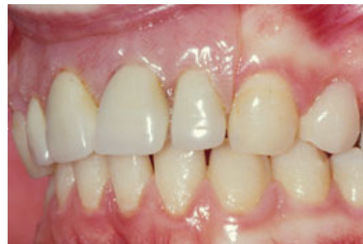
Plaatprothese van opzij