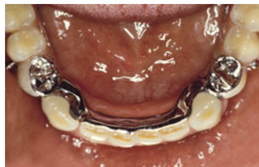
Frameprothese met verankering op kronen